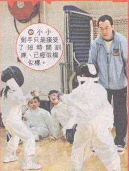
小小劍手只是接受了短時間訓練，已經似模似樣。

名校巡禮 藝術與體育已是新一代學校教學的趨勢，走進啟基學校從外牆的藝術圖畫開始，到與別不同的班房命名，再走到色彩鮮豔的米羅洗手間，到處可見同學仔的精心創意；而體育都係小學生發揮創意的途徑，近年啟基在有型兼「食腦」的劍擊項目稱霸學界，為劍壇培育未來接班人，可稱是香港「小劍手」的搖籃。