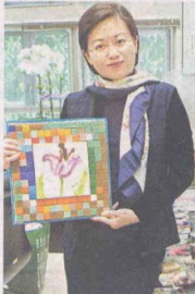
莫校長展示學生的藝術品。

從一至六年級級級都有不同內容的戲劇課程，直至六年級校方更需要寫劇本，話唔定將來啟基的畢業生會是李安導演的接班人。 此外，校內設有四十多個課外活動，有動有靜如舞藝、曲棍球、書法、國畫、中國舞等，而基本上每一個同學都會參加一項或以上的活動。開時會跳健康舞或打乒乓球的莫校長稱：「我會找來最好的導師，希望同學得到最專業的知識，亦協助他們發掘不同興趣，並且在校園享受開心生活。」近年全校學生更多參與跳繩心計畫，更獲得不少優異獎項。